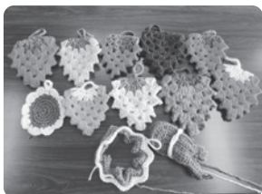
▲アクリルタワシづくり

歌って、笑って、おしゃべりをして、心も体も元気になりましょう! どなたでもご参加いただけます。ぜひ、皆さん、お誘い合わせてお越しください。