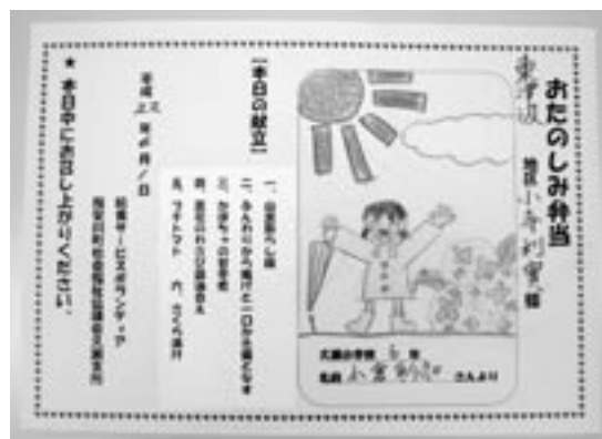
久瀬小学校児童の絵の一部

高齢者の方への励ましの絵やメッセージは、宝物だと久瀬地域の高齢者から、とても喜ばれています。