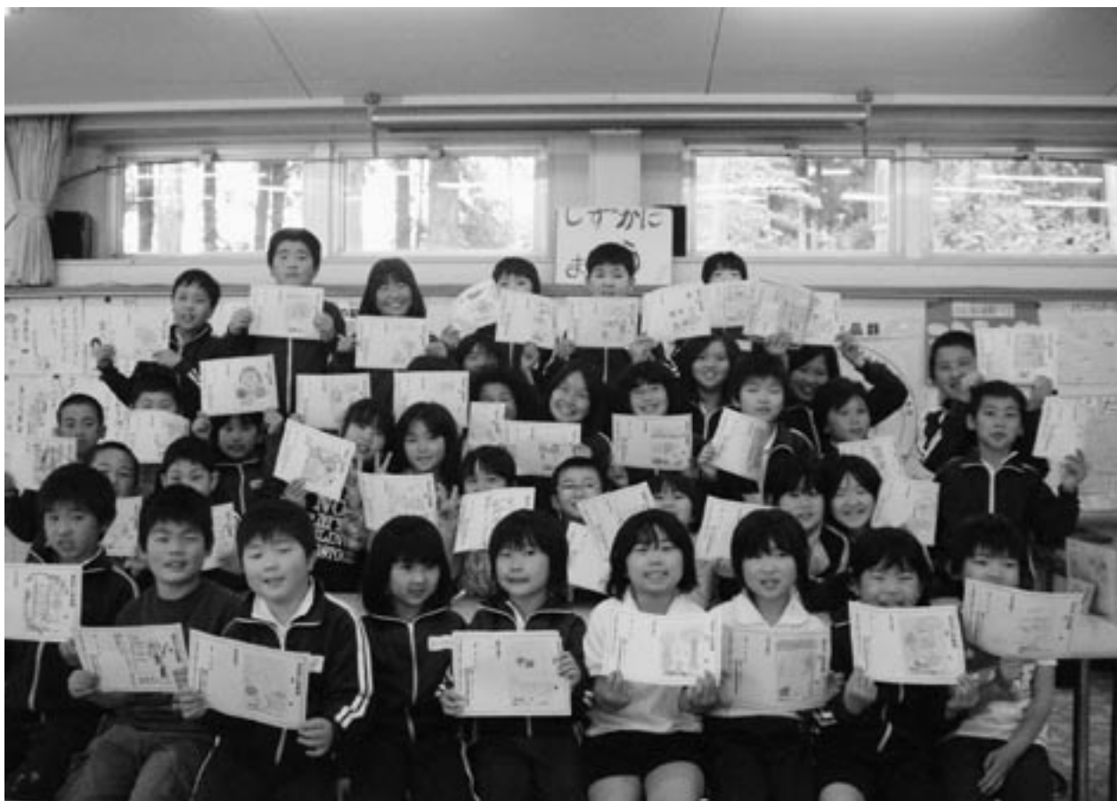
久瀬小学校全員でハイポーズ！