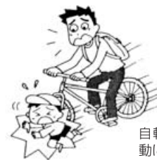
自転車でボランティア活 動に向かう途中、誤って他 人にケガをさせた