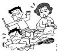
清掃ボランティア活動中、 転んでケガをした

(1) 障害事故 ボランティアがボランティア活動中の急激・偶然・外来の事故によりケガをした場合に保険金をお支払いします。