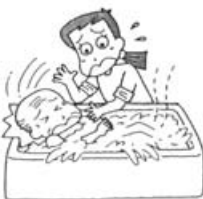
入浴ボランティア活動 中、誤ってお年寄りにケ ガをさせた

(2) 賠償事故 ボランティアがボランティア活動中の偶然の事故により他人にケガをさせたり、他人の物を壊したことにより、法律上の損害賠償責任を負った場合に保険金をお支払いします。