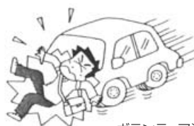
ボランティア活動に向かう途 中、交通事故にあった