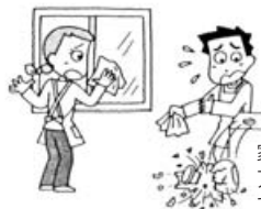
家事援助ボランティ ア活動で清掃中、誤っ て花瓶を落とした