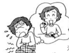
活動中、食べた弁当 でボランティア自身が食中毒 になった

(2) 賠償事故 ボランティアがボランティア活動中の偶然の事故により他人にケガをさせたり、他人の物を壊したことにより、法律上の損害賠償責任を負った場合に保険金をお支払いします。